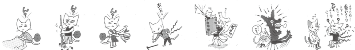
イラスト：久保谷智子